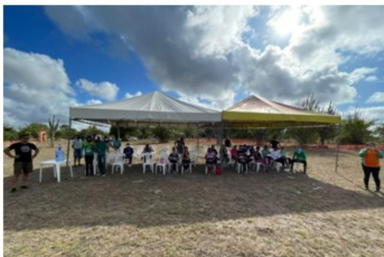
Toldos- equipe de organização.