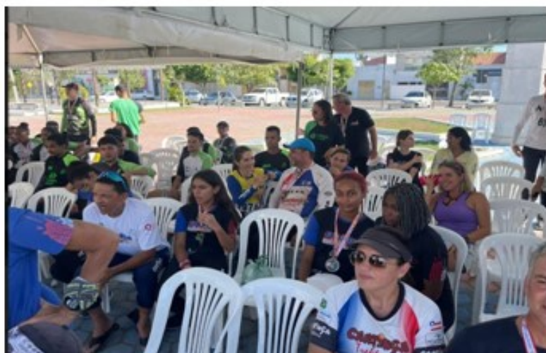
Toldos- base de orientação as participantes