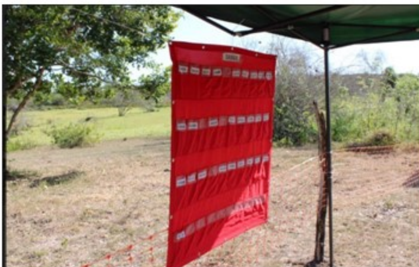
Local de prova