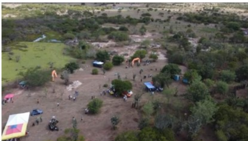
Estrutura do alto