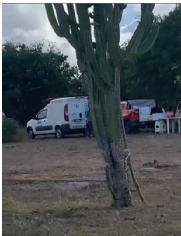
Ambulância e estrutura