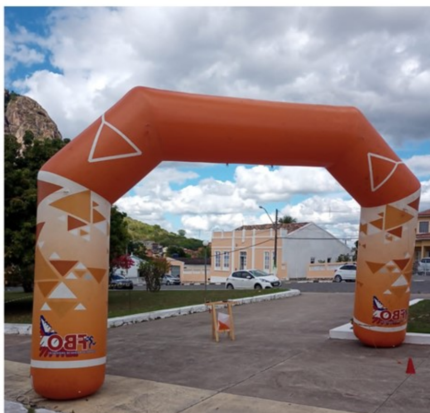
Largada / chegada