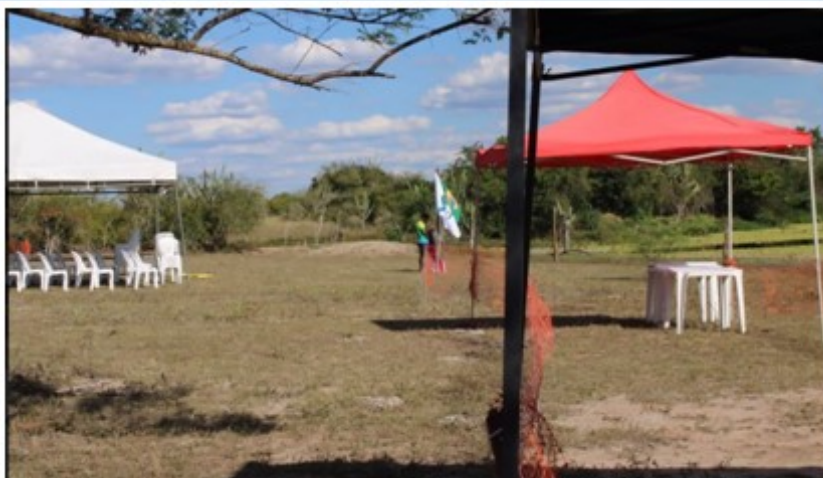
Estrutura e toldos