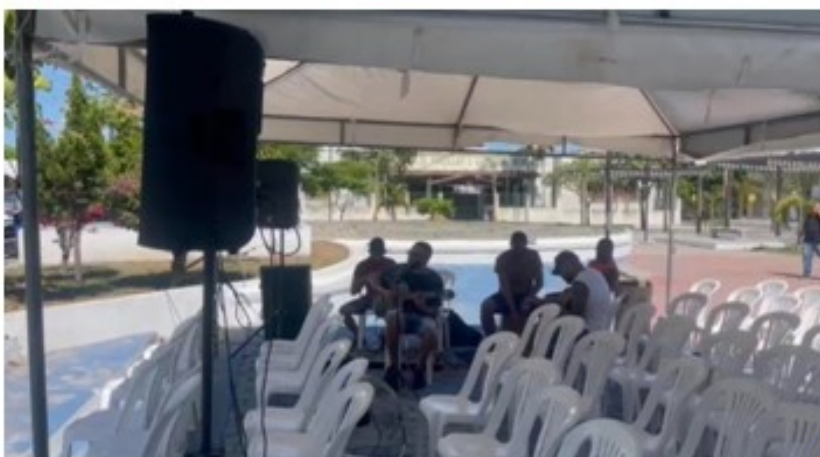
Sonorização e banda