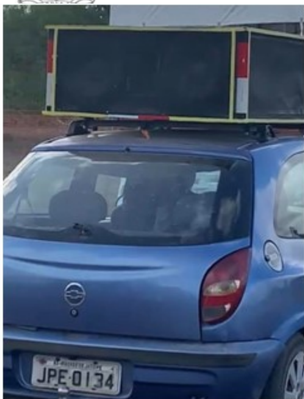
Carro de som