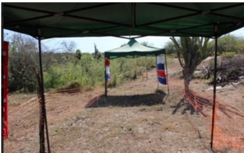
Local de prova