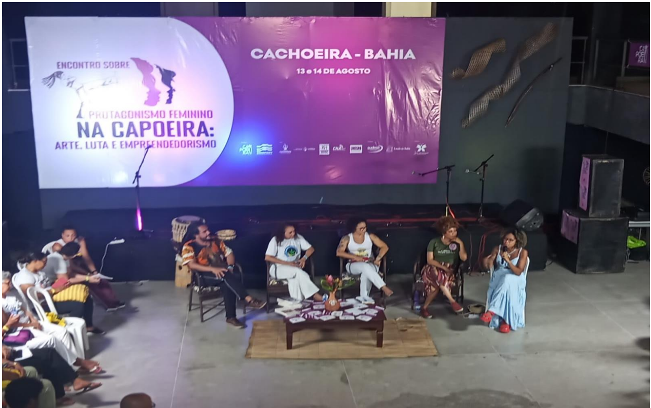
Registro de uma das mesas temáticas do evento