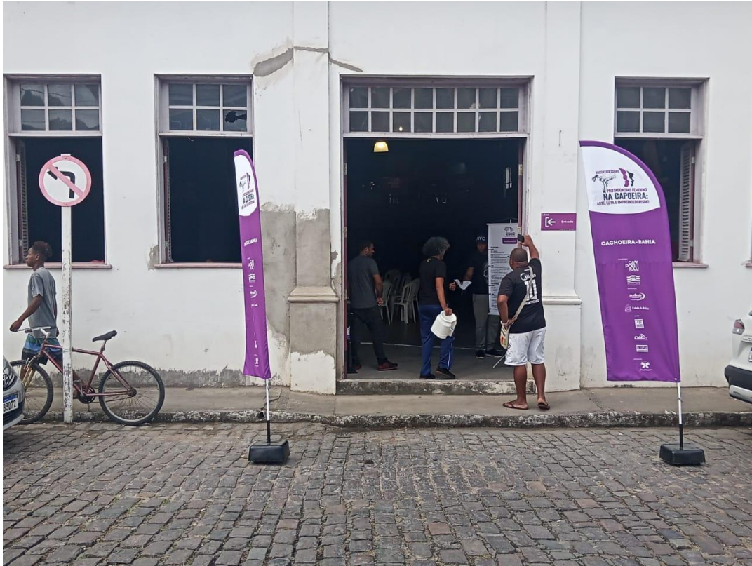
Registro de wind banner disponibilizado na entrada do local do evento.