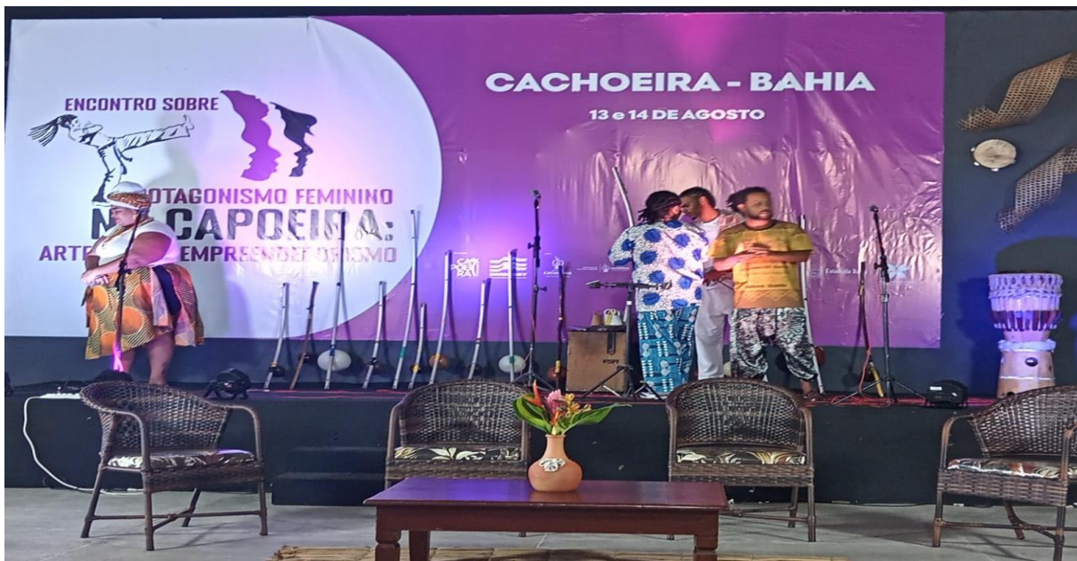
Registro do espaço de realização do evento e preparação da apresentação da Orquestra de Berimbau.