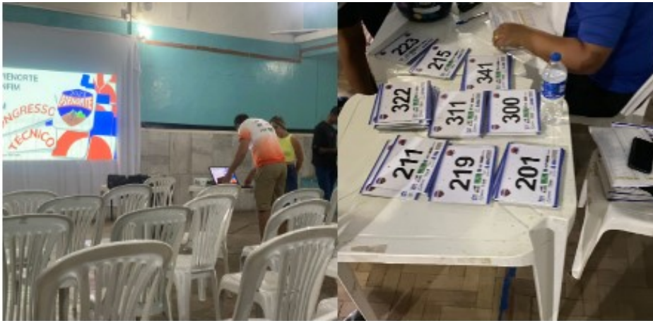
Congresso técnico Entrega de placas