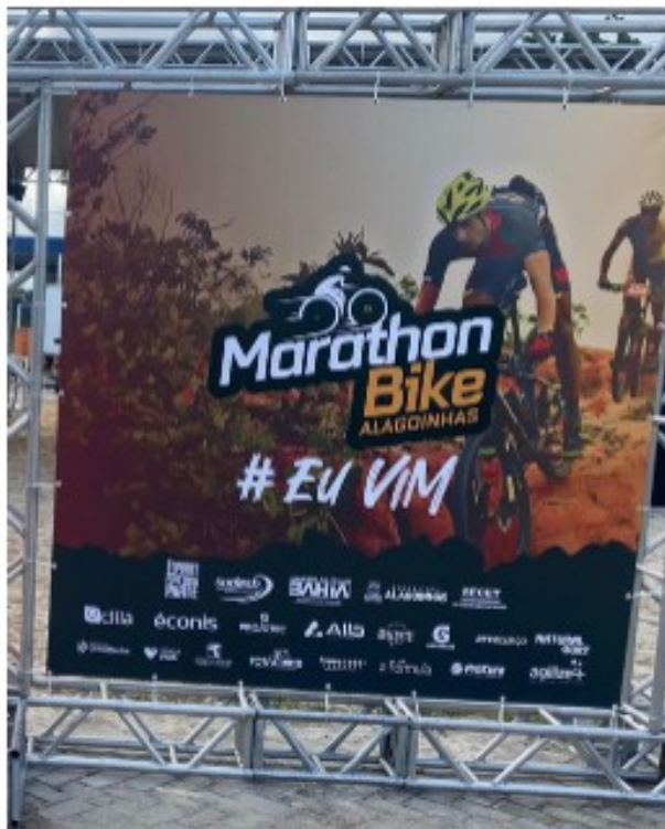
Estrutura Box Truss Fundo de pódio e Backdrop