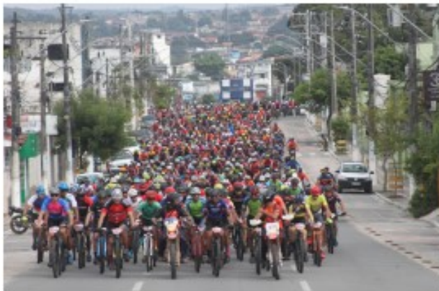
Atletas na prova