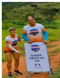
Camisa STAFF e Sinalização percurso