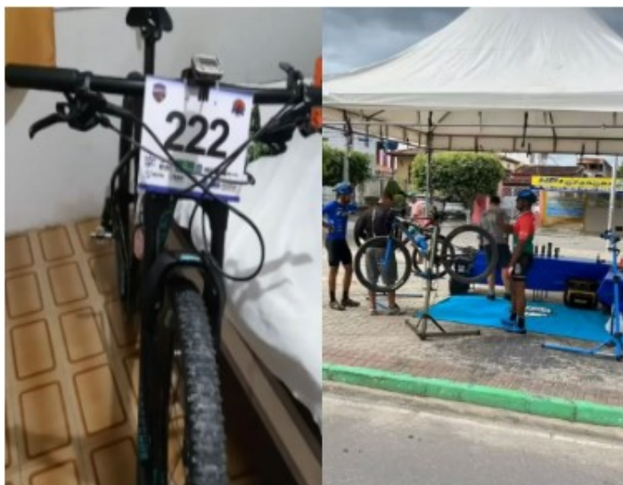
Placas Local manutenção bikes