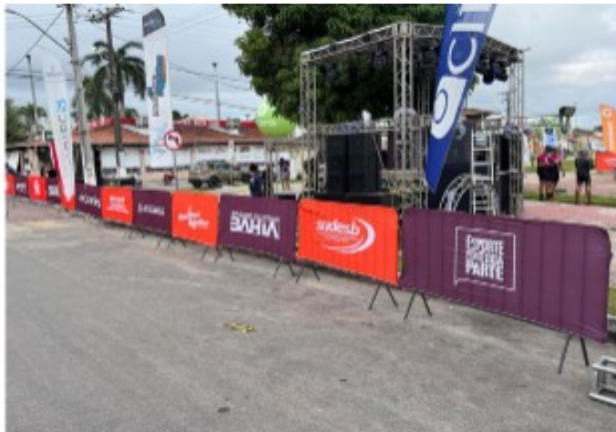
Grade de contenção, banner marcas governo e sonorização parte visual/divulgação