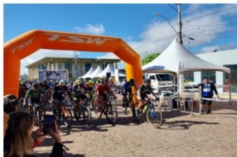
PÓRTICO DE LARGADA