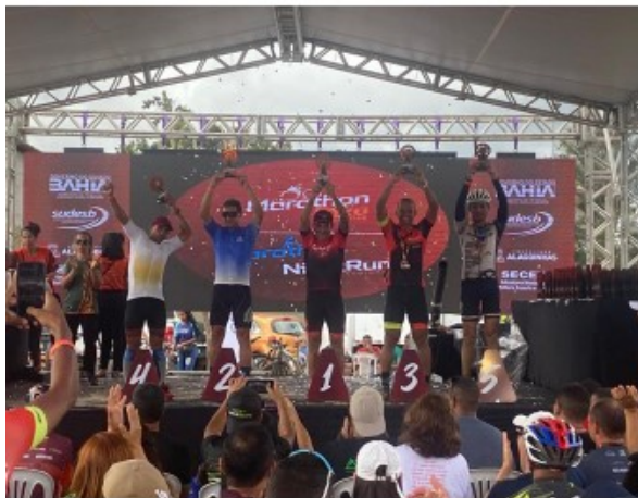
Entrega de troféus e medalhas.