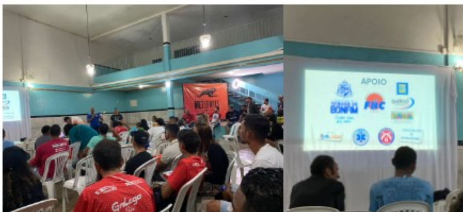
Troca de informações