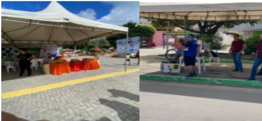
Mesa café frutas e hidratação Locutor