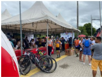
local do evento