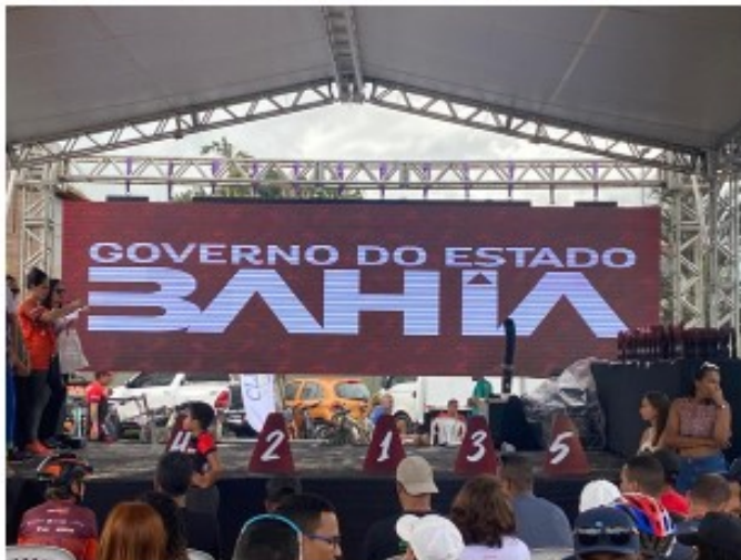
Palco premiação, toldos e troféus.