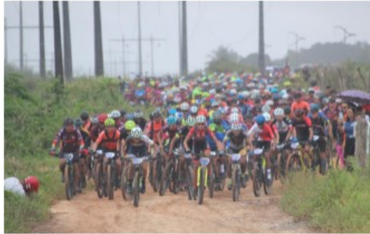
Atletas na prova placas personalizadas.