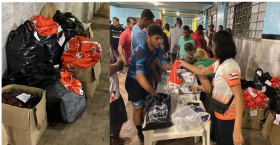
Entrega de Kits