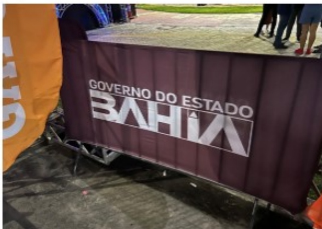
Grade de contenção banner marca Governo do Estado