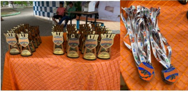
Troféus e medalhas