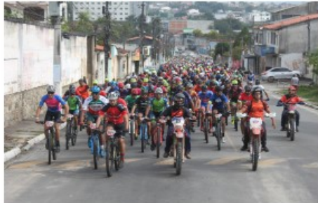
Atletas na prova, moto com pilotos suporte.