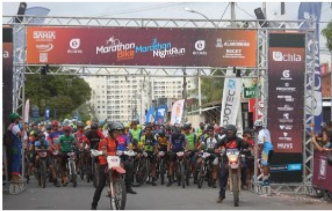
Estrutura Box Truss Pórtico de largada