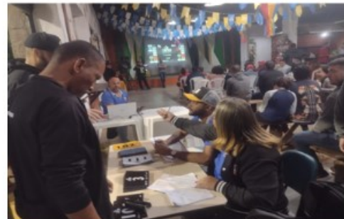
LOCAL DA INSCRIÇÃO