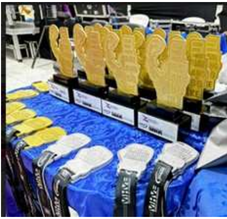
MEDALHAS E /TROFÉUS