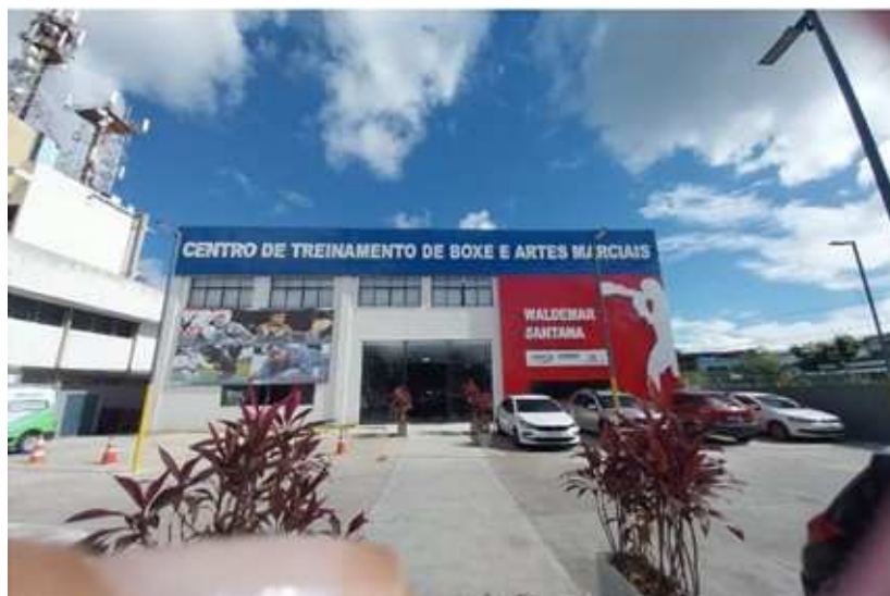
LOCAL DO EVENTO