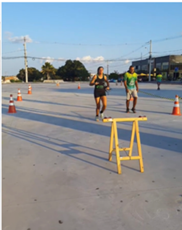
Estrutura percurso sprint 02/09/2023