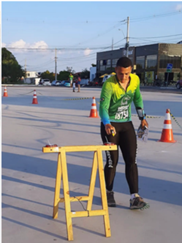
Estrutura percurso sprint 02/09/2023