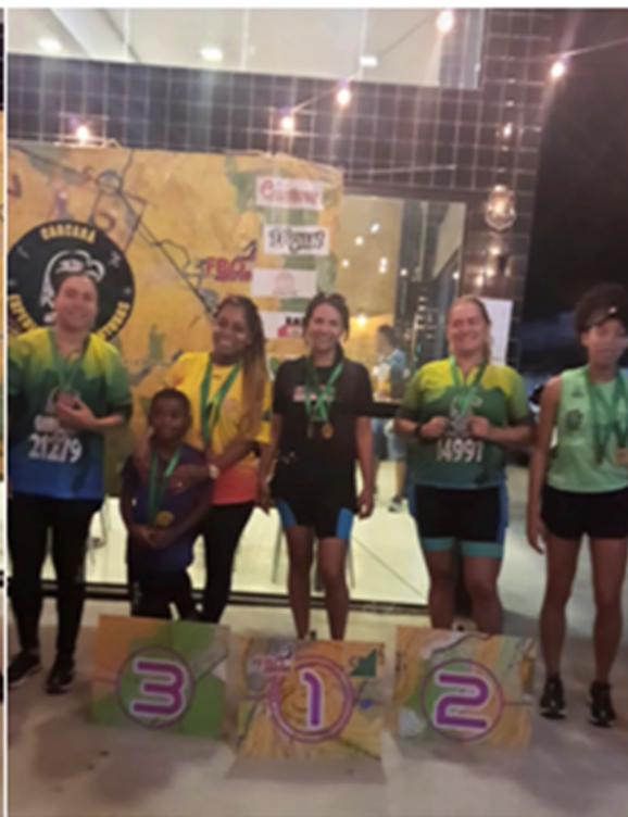
Premiação | percurso sprint 02/09/2023