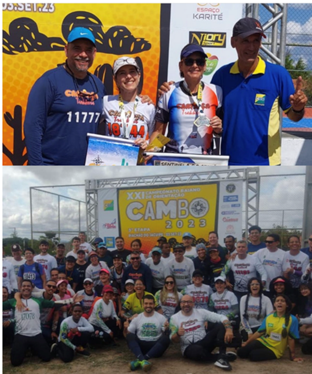
Prova Floresta 03/09/2023