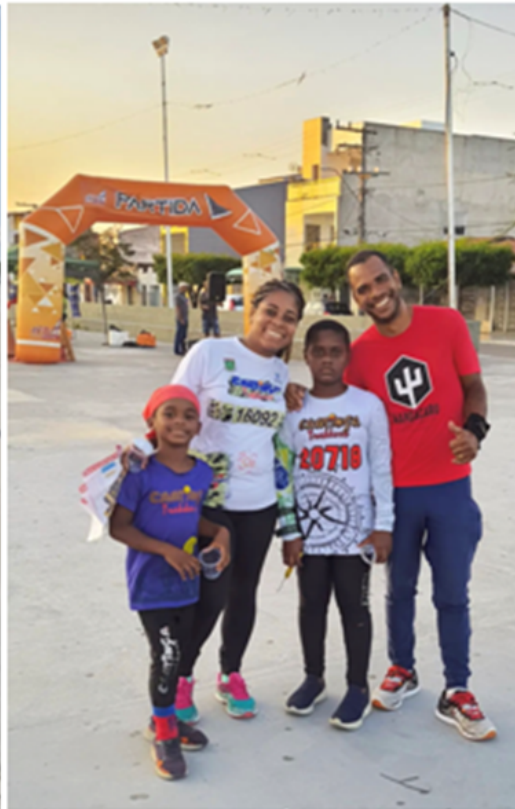
Estrutura percurso sprint 02/09/2023