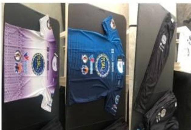
FARDAMENTO DOS PROFISSIONAIS E ALUNOS