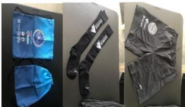
SACOLAS, MEIÃO E SHORT