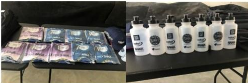
GARRAFAS DE ÁGUA, BONÊS E CAMISAS