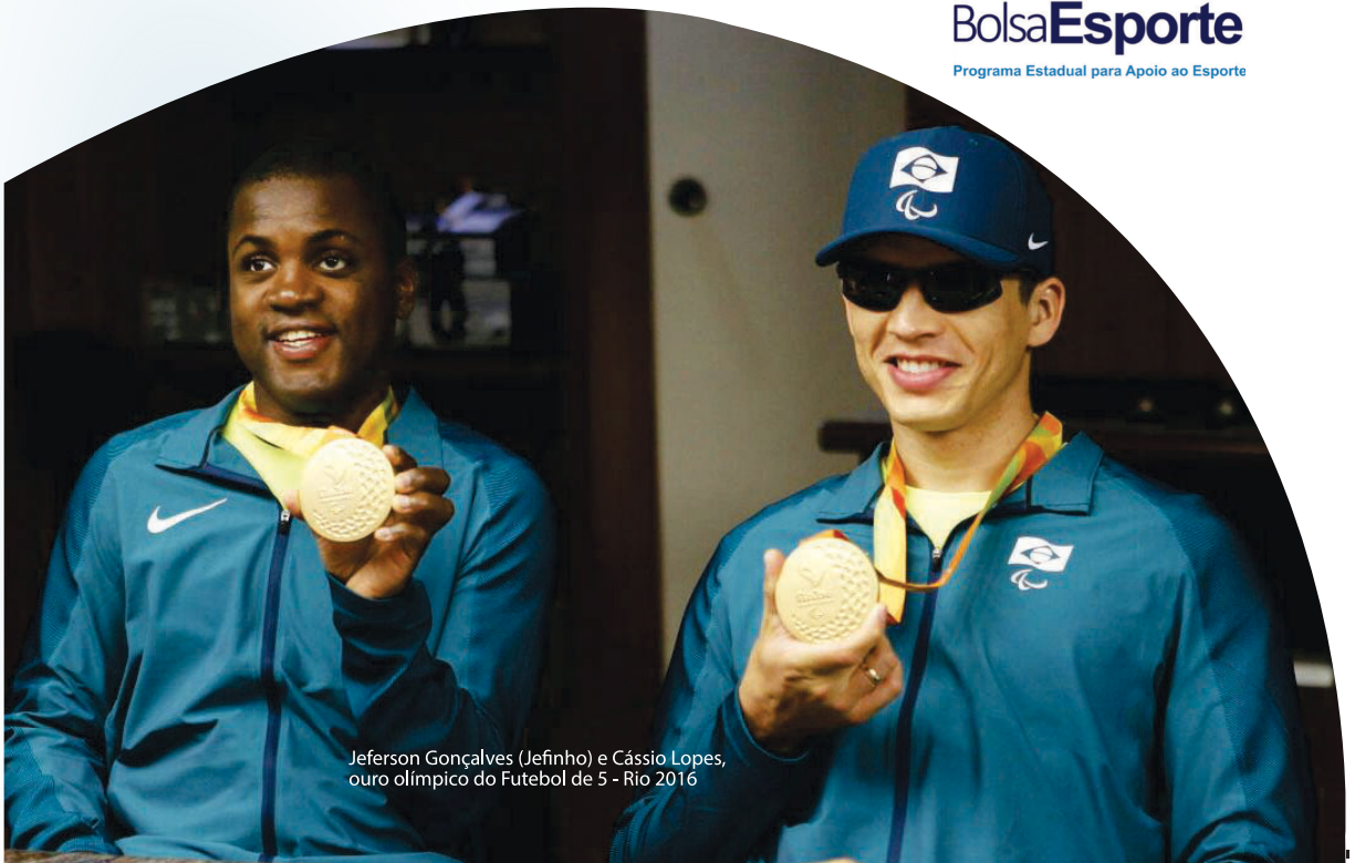
Jeferson Gonçalves (Jefinho) e Cássio Lopes, ouro olímpico do Futebol de 5 - Rio 2016