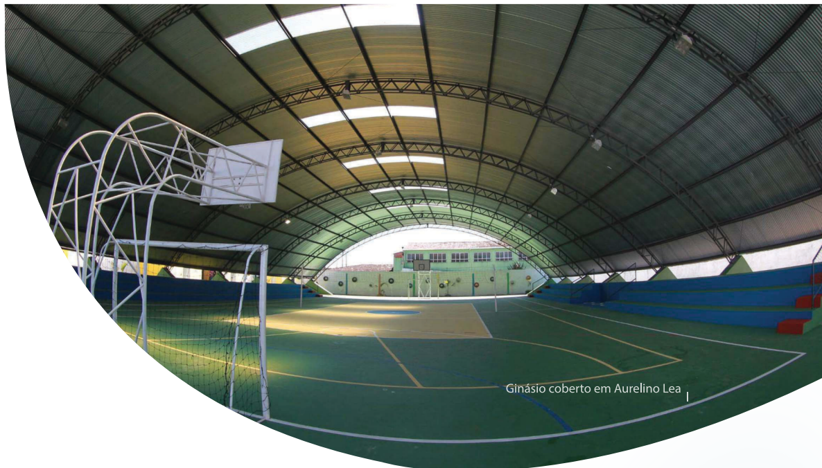
Ginásio coberto em Aurelino Lea